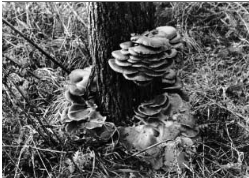
Késői laskagomba nyárfán, természetes körülmények között

forint volt. Hollandiai szakmai tapasztalatok után magyar tervezéssel, magyar építőanyagokból, teljes egészében magyar kivitelezésben készült. Külföldről, Hollandiából származnak a légtechnikai berendezések. A ház fő váza szendvicspanel szerkezettel készült, s a házon belül található 12 termesztő szoba, amely összesen 6.024 m 2 termőfelületet ad.