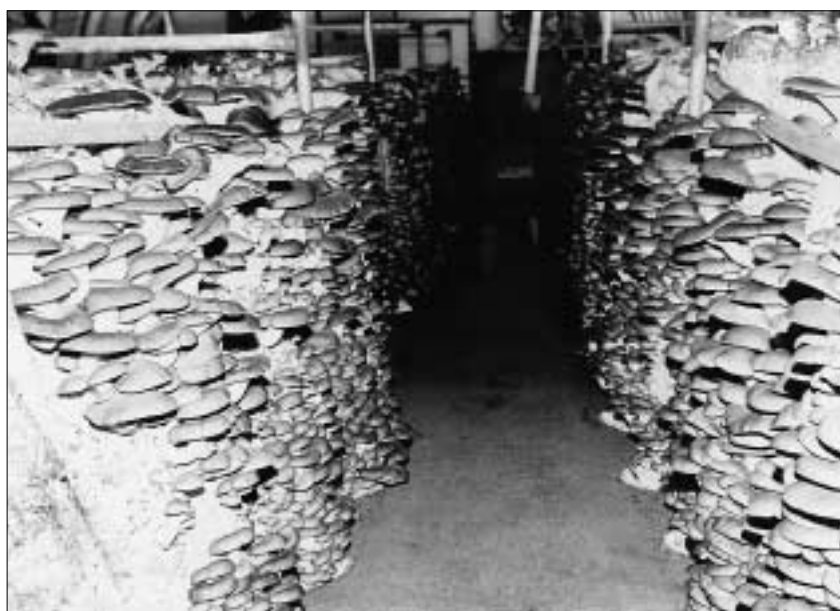
Laskagomba kukoricacsutkán termesztve

A hazai csiperketermés mennyisége az elmúlt két évben