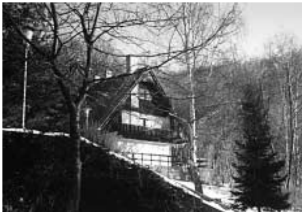
Télen is szembetűnőek a Gyermek- és Ifjúsági Tábor kitűnő adottságai

Olyan borok kerültek ki a pincéjéből, amelyek díjakat nyertek, s a Soproni Borvidékre irányították a figyelmet. S egyúttal felrészelték a soproni borászokat is, mert nemes verseny indult meg. Személyében megkezdődött a burgenlandi, Ruszti valamint a Soproni borvidék összefogása. A szomszédos Burgenlandban 2500 hektáron termesztik a Kékfrankost, Sopronban mintegy 1000 hektáron. Az összefogás